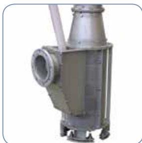
Boca de entrada y cesto tamiz de chapa perforada