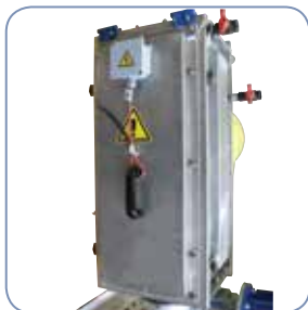
Módulo de descarga aislado