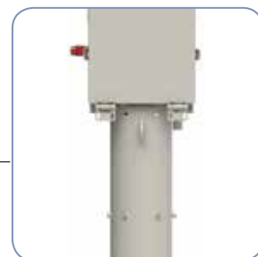
Tubo de lavado