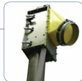
Boca de salida altamente eficiente en material plástico